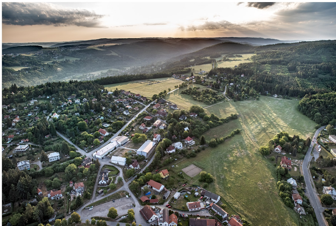
Hradištko, květen 2018