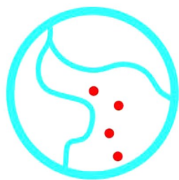
MEZI ŘEKAMI, z. s.

Pořádá Mezi řekami, z.s., OÚ Hradištko, Obecní knihovna Hradištko společně s obcemi regionu.