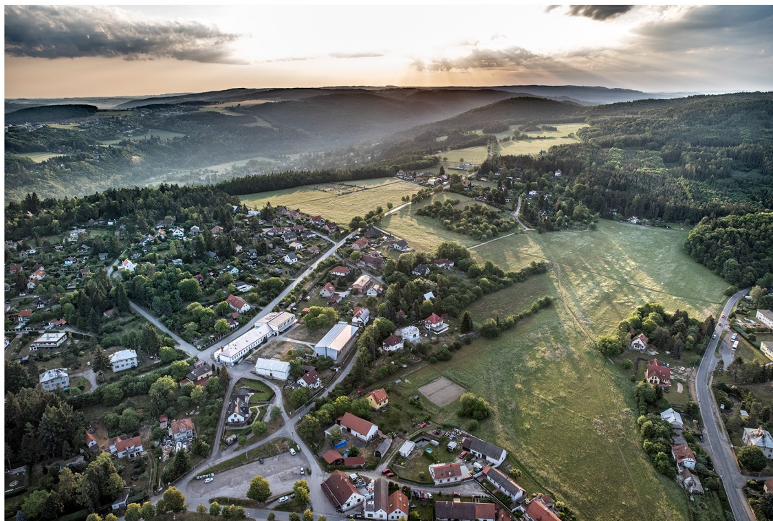
Hradištko, květen 2018

2. prosince 2018, zámek na Hradištku v 13.00, následuje přednáška archeologa Jana Viznera o historii zámku a obce Hradištko.